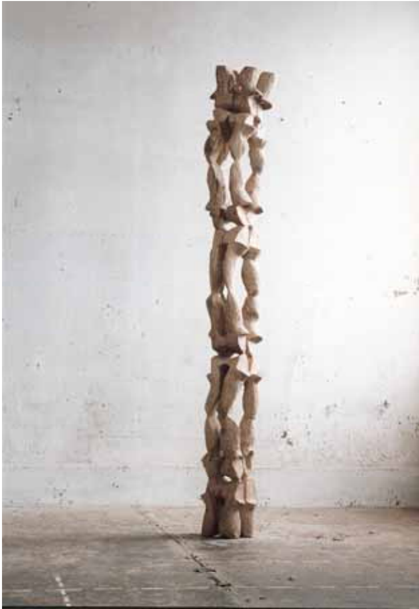
Schuhe, 1996, Eiche, H 240 cm severinmuller.com