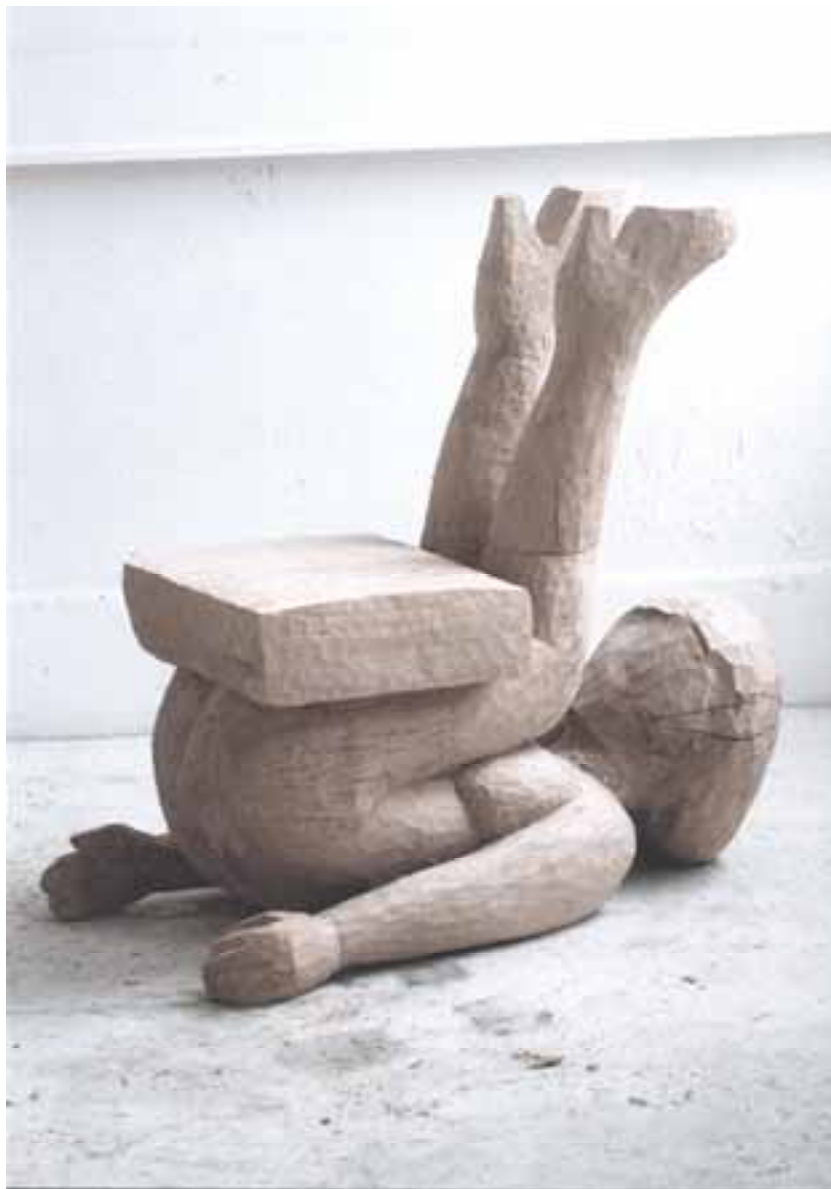
Stuhl, 2000, Eiche, 100x60x50 cm severinmuller.com