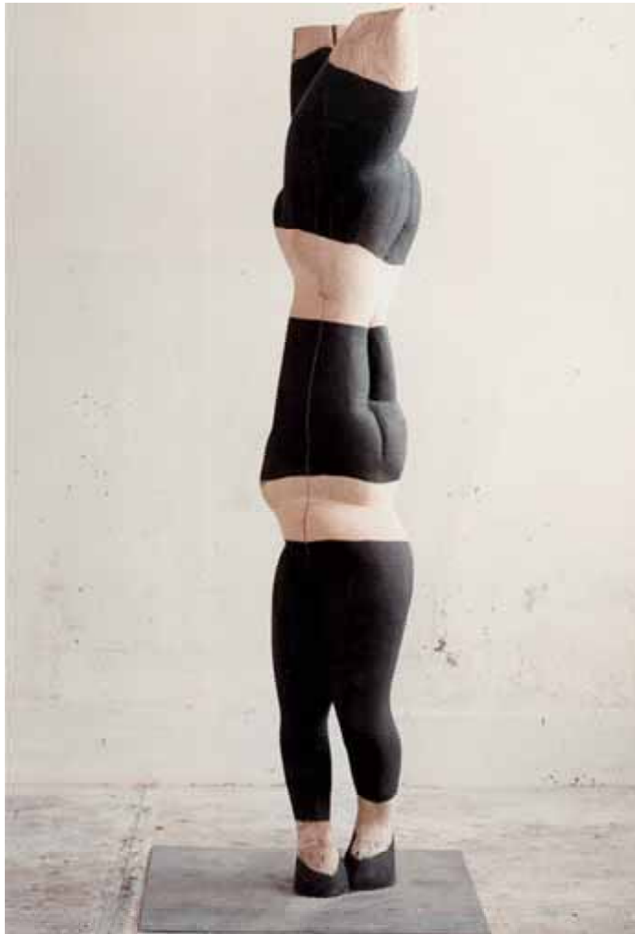
Constanze, 1995, Eiche, H 240 cm severinmuller.com