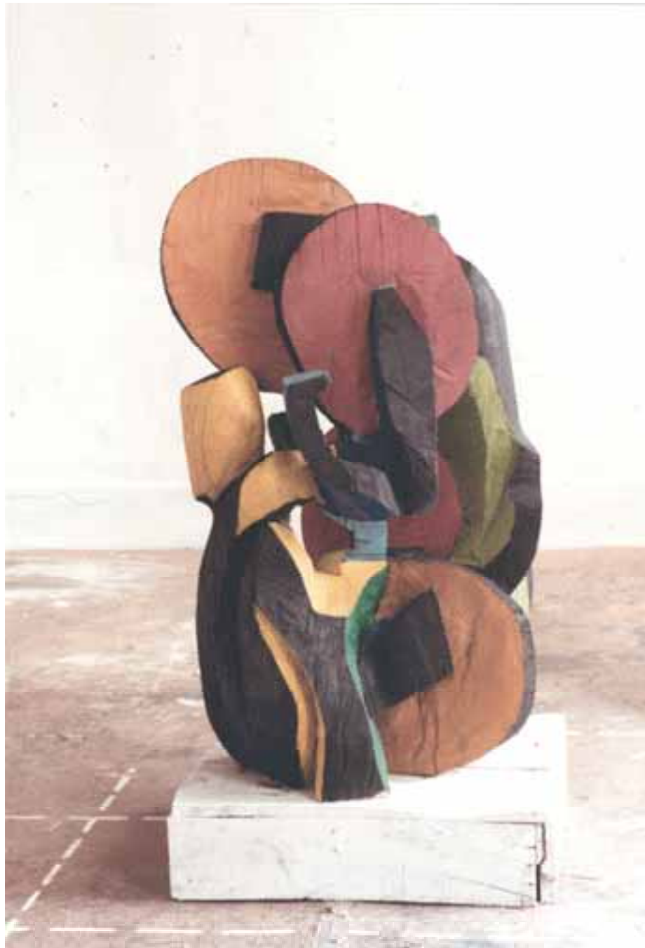
Fahrradunfall, 1994, Eiche, H 150 cm severinmuller.com