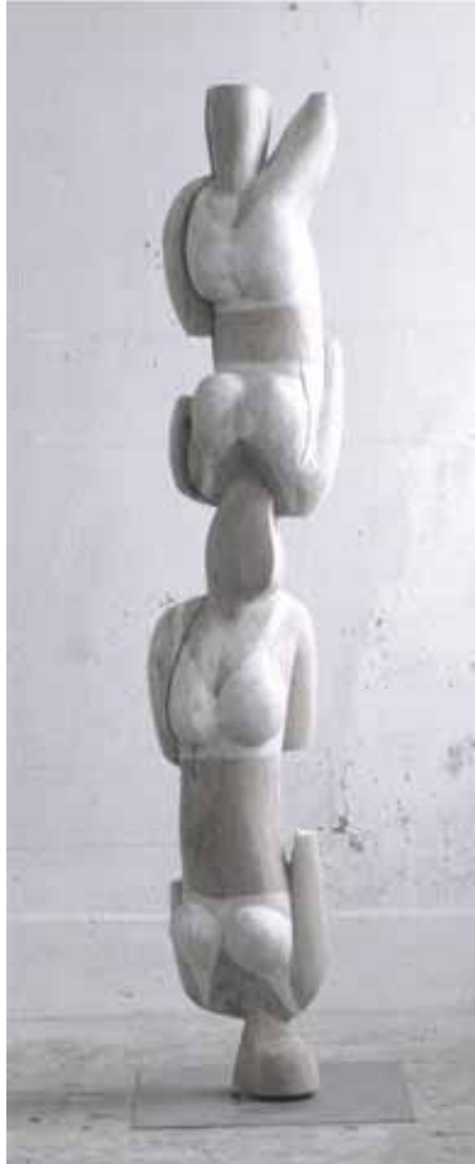
Constanze, 1996, Ulme, H 220 cm severinmuller.com