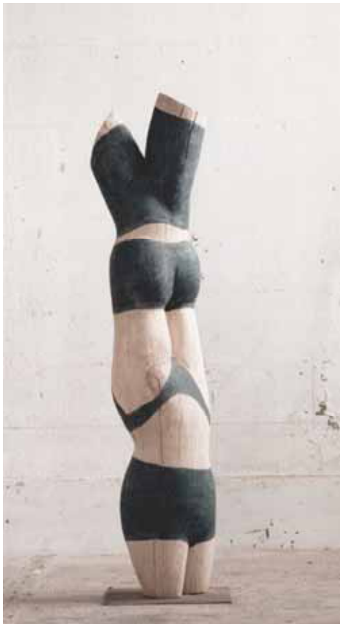
Constanze, 1997, Eiche, H 145 cm severinmuller.com