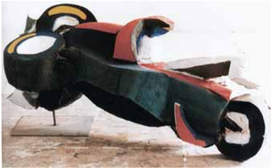
Müller – Racing, 1995, Ulme, 70x210x65 cm severinmuller.com