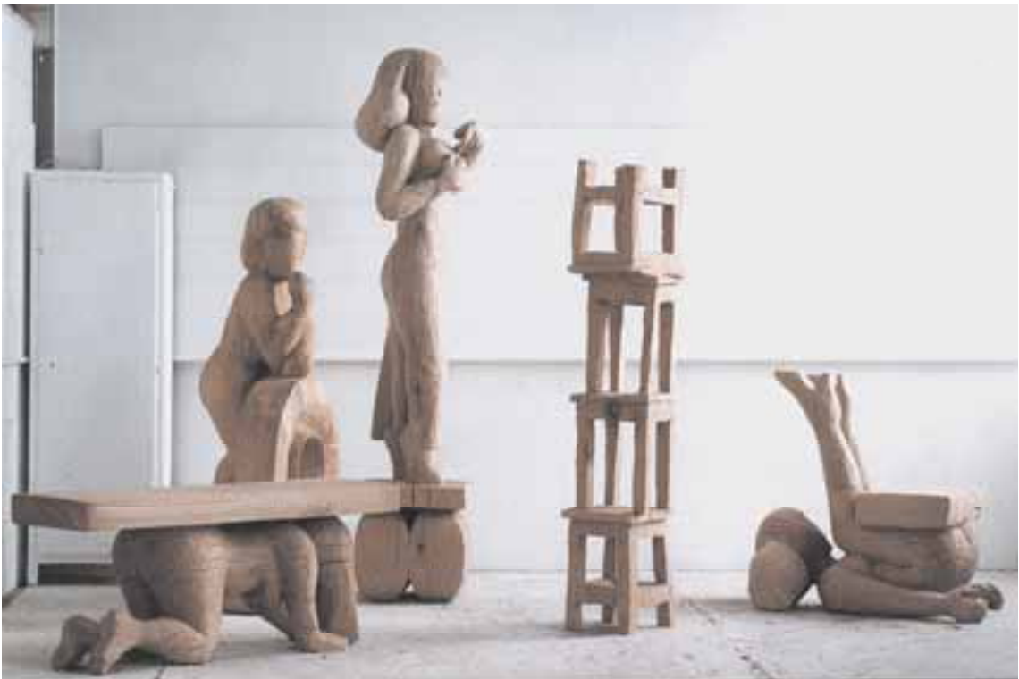
Skulpturen, 1999 – 2000, Eiche, H 50 cm – 240 c cm severinmuller.com