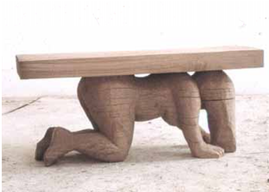
Tisch, 1999, Eiche, 61x133x50 cm severinmuller.com