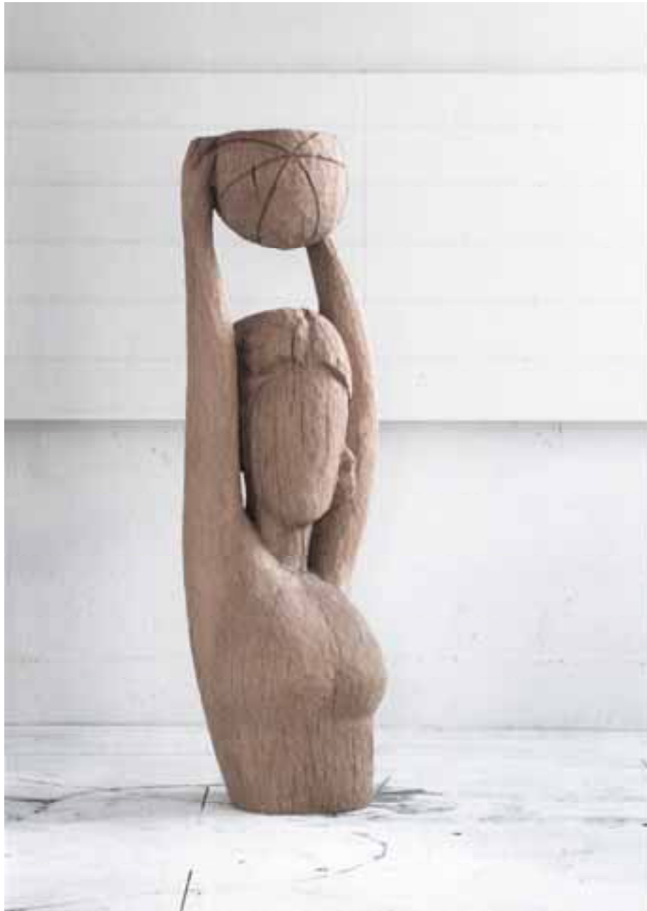
Mädchen mit Ball, 2000, Eiche, H 170 cm severinmuller.com