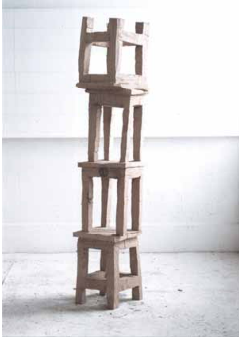
Stühle, 1999, Eiche, H 180 cm severinmuller.com