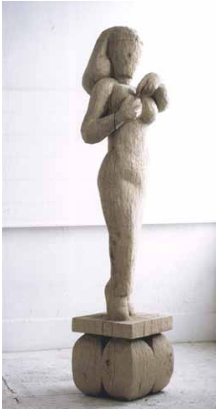
Eiertanz, 2000, Eiche, H 230 cm severinmuller.com