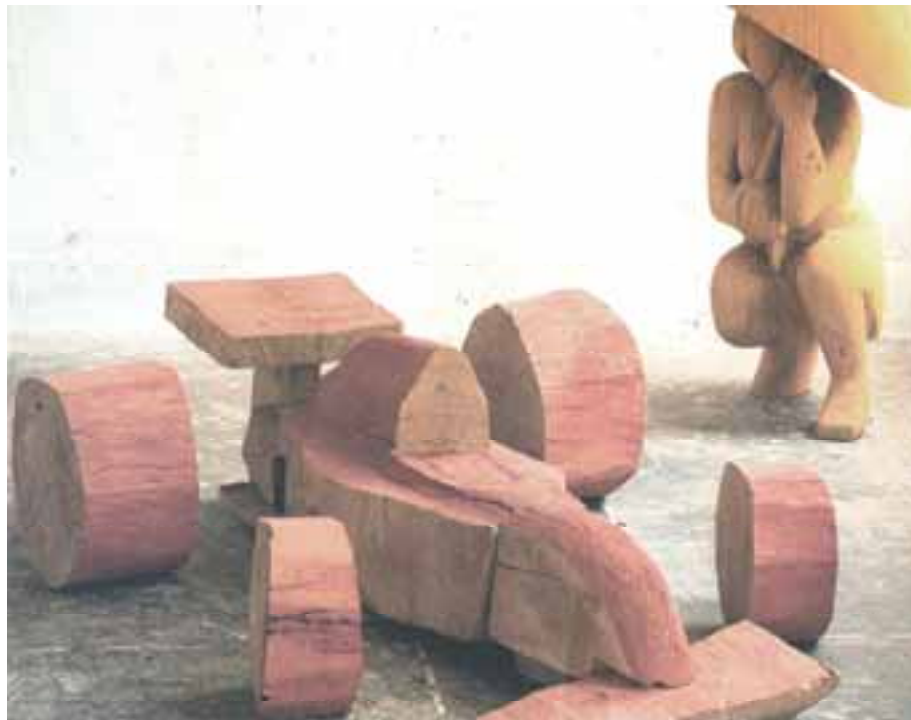
Müller – Racing, 1997, Eiche, 55x220x180 cm severinmuller.com