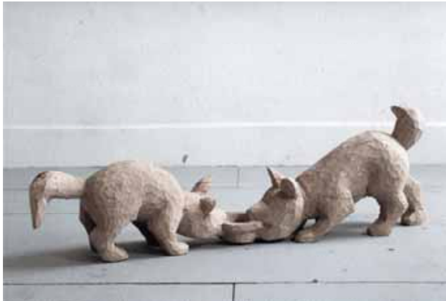
Neid und Habgier, 2001, Eiche, 54x28x175 cm severinmuller.com