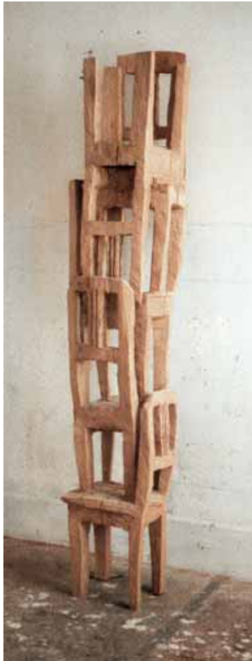
Stühle 2, 1997, Eiche, H 230 cm severinmuller.com