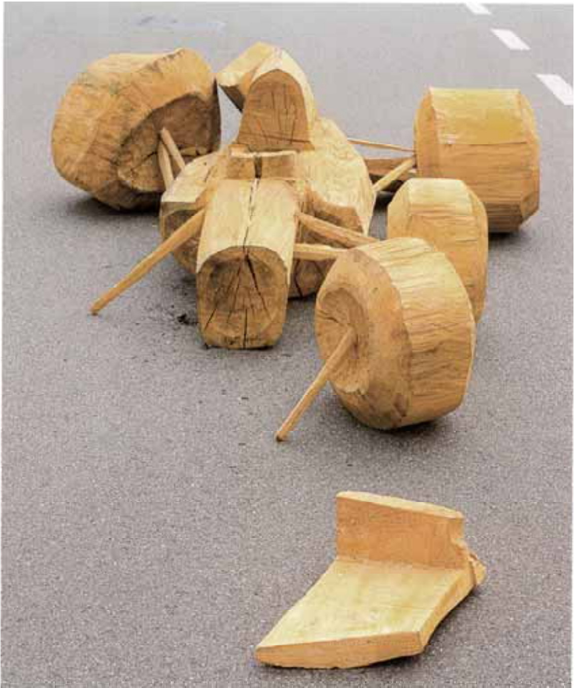
Müller – Racing, 1992, Pappel, 70x320x260 cm severinmuller.com