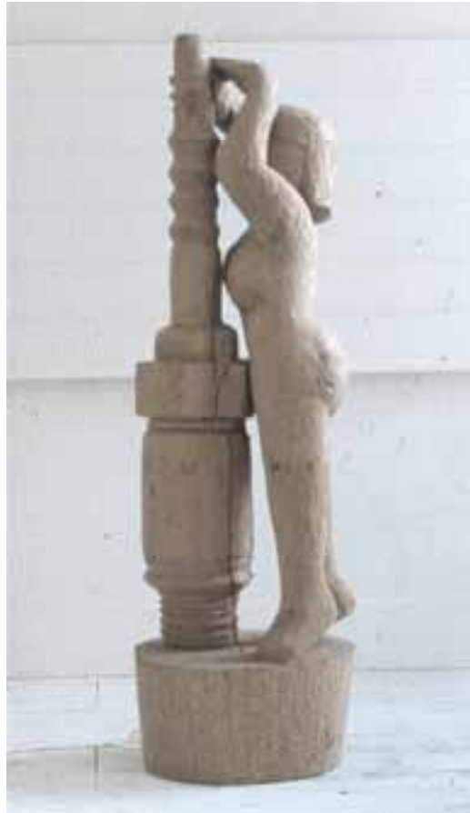
Zündkerzenverkäuferin, 1999, Eiche, H 195 cm severinmuller.com